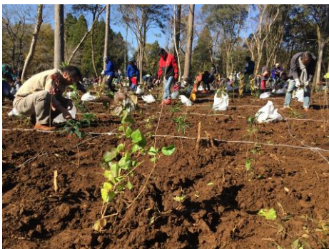
2017年11月 第2回千葉市植樹