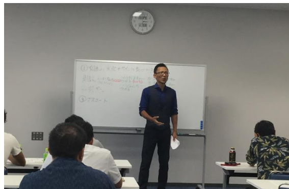
「ミライカレッジいしのまき」事前セミナー