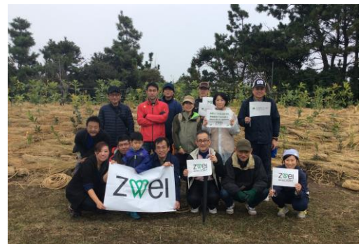
2015年11月 第3回浦安市植樹