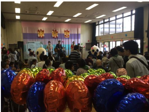
杉並区立すぎのき生活園の杉実祭での風船プレゼント