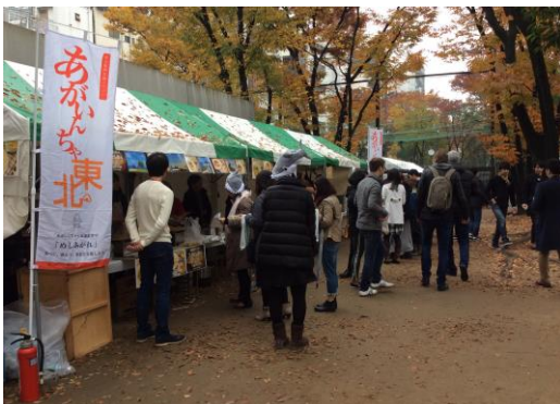
「あがいんちゃ東北」