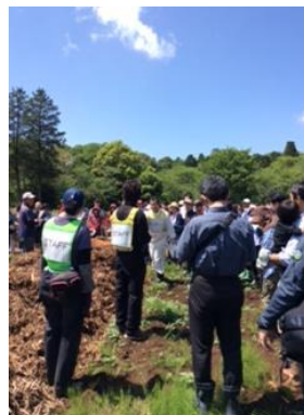
2016年11月 第1回千葉市植樹