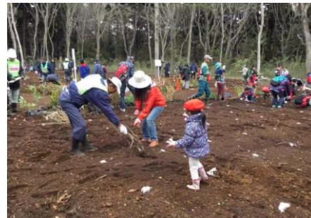
2018年11月 第3回千葉市植樹