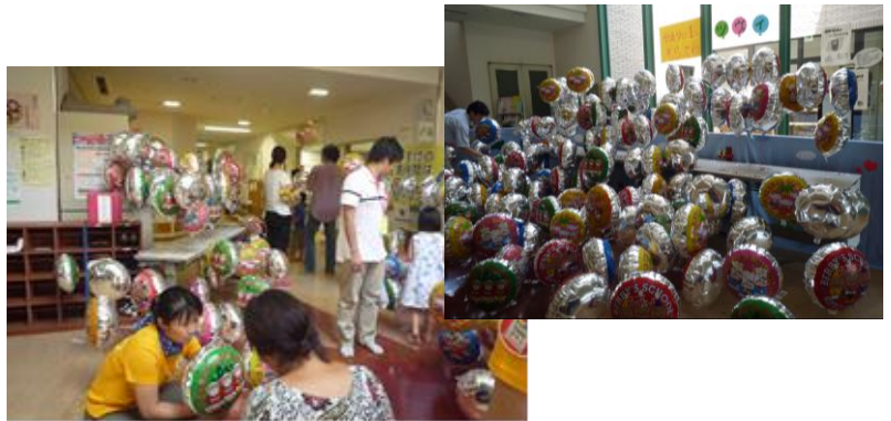
杉並区立こども発達センター夏祭りでの風船プレゼント