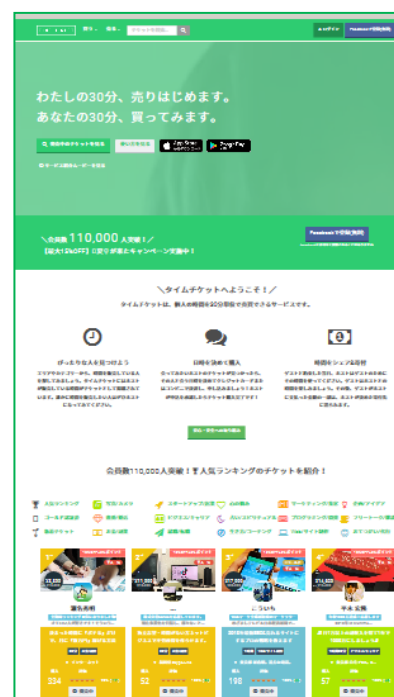
「タイムチケット」トップページ

生涯未婚率が過去最高を更新し、未婚化・晩婚化が進行する中、異性との交際経験がない若者が増えており、婚活が上手くいかないストレスから「婚活疲れ」を起こして人生に消極的になったり、「異性と上手く付き合えない」という理由で結婚できないという未婚者も増えています。このような状況の中、きめ細かいサポートへのニーズが高まっており、ツヴァイでは、出会いの機会の提供にとどまらず、結婚への心構えや男女のコミュニケーションスキルを学ぶ講座や、マンツーマンレッスン等、会員さまを対象とした講座の充実を図っております。