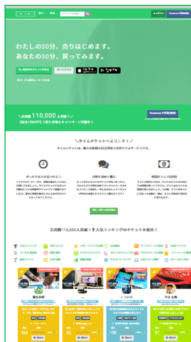
「タイムチケット」トップページ

生涯未婚率が過去最高を更新し、未婚化・晩婚化が進行する中、異性との交際経験がない若者が増えており、婚活が上手くいかないストレスから「婚活疲れ」を起こして人生に消極的になったり、「異性と上手く付き合えない」という理由で結婚できないという未婚者も増えています。このような状況の中、きめ細かいサポートへのニーズが高まっており、ツヴァイでは、出会いの機会の提供にとどまらず、結婚への心構えや男女のコミュニケーションスキルを学ぶ講座や、マンツーマンレッスン等、会員さまを対象とした講座の充実を図っております。