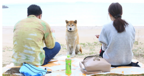
若者ライフデザイン事業 「ミライカレッジ壱岐」ツアー 2015年11月