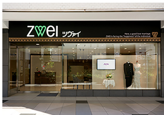
ツヴァイ赤坂見附 (千代田区永田町 2-14-3 東急プラザ赤坂 2階)