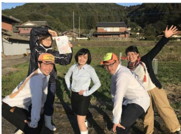
佐賀県嬉野市の鳥獣被害低減を目指して… 悩む地元農家のために立ち上がる『嬉野狩部』の皆さん

クラウドファンディング詳細: https://www.makuake.com/project/ureshinokaribu/