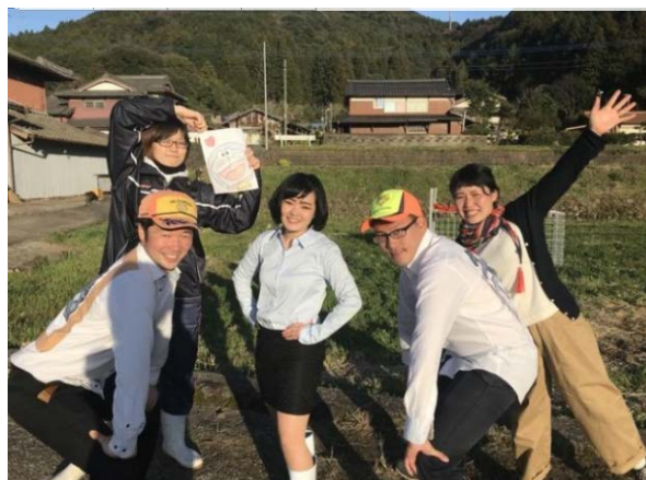
佐賀県嬉野市の鳥獣被害低減を目指して… 悩む地元農家のために立ち上がる『嬉野狩部』の皆さん

クラウドファンディング詳細: https://www.makuake.com/project/ureshinokaribu/