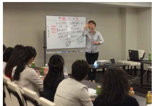
入会初期の会員さまを対象に開催している「出会い準備講座」の様子

この度、受講者からの要望を受けて「出会い準備講座」の発展版という位置付けで、新たに展開する「ステップアップ講座(デート前のトレーニング講座)」は、気になるお相手に出会ってから交際に発展させるためにどうしたらよいかを学ぶ内容となっています。7月15日(土)より2カ月に1度、まずは東京・大阪・名古屋の店舗で開催し、今後はエリアを拡大して展開してまいります。