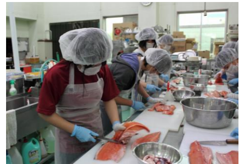
ほんもの体験 秋鮭の切り身作り