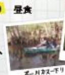
ポー川カヌー下り