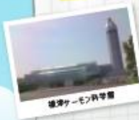
標津サーモン科学館