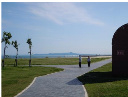
「海の公園キャンプ場」