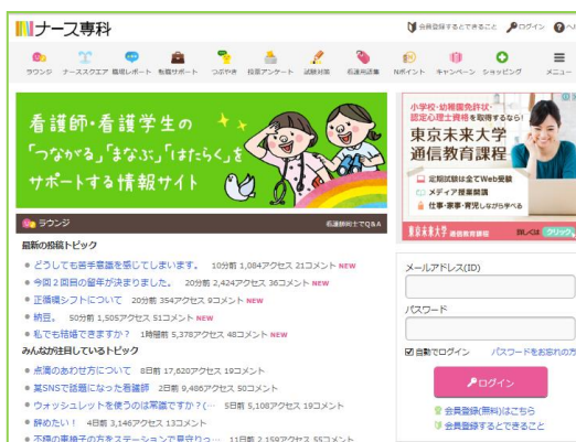
ナース専科 PC サイト http://nurse-senka.jp/

一般的に、『忙しく』『女性が多い職場』のイメージが強く、出会いが少ないと言われている看護師。2016年6月に『ナース専科』の看護師会員に聴取した『婚活サービスに関するwebアンケート』（母数：628人）でも、25～29歳の未婚率が72.4%（一般女性25～29歳未婚率：61.0%※）、30～34歳の未婚率が48.8%（一般女性30～34歳未婚率：33.7%※）という結果となり、相対的に未婚率が高い状況となっています。※2015年国勢調査より