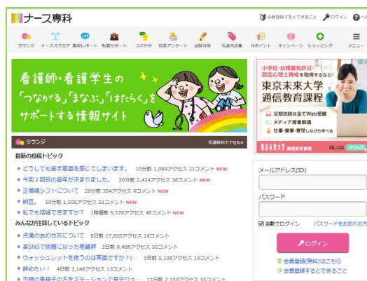
ナース専科 PC サイト http://nurse-senka.jp/

一般的に、『忙しく』『女性が多い職場』のイメージが強く、出会いが少ないと言われている看護師。2016年6月に『ナース専科』の看護師会員に聴取した『婚活サービスに関するwebアンケート』（母数：628人）でも、25～29歳の未婚率が72.4%（一般女性25～29歳未婚率：61.0%※）、30～34歳の未婚率が48.8%（一般女性30～34歳未婚率：33.7%※）という結果となり、相対的に未婚率が高い状況となっています。※2015年国勢調査より