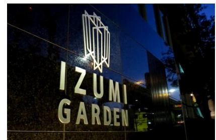
泉ガーデンギャラリー（六本木）

開催日時：2016年7月15日（金） 18：30～21：00（受付17：30～） 開催場所：泉ガーデンギャラリー （東京都港区六本木1-5-2） 対象：女性 25歳～40代くらいまでの独身の方 料金：一般の方→5,500円 クラブチャティオ会員（登録無料）→5,000円 お友達割チケット（2枚）→10,000円 定員：500名 服装：パステルカラーを取り入れた服装でお越し下さい！ 詳細、申込み： https://www.clubchat.io.jp/cam/girlsummerparty/