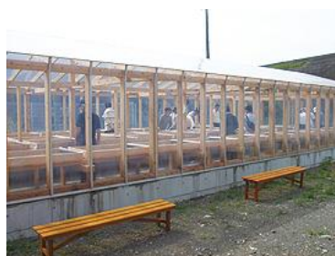
田野町完全天日塩製塩体験施設