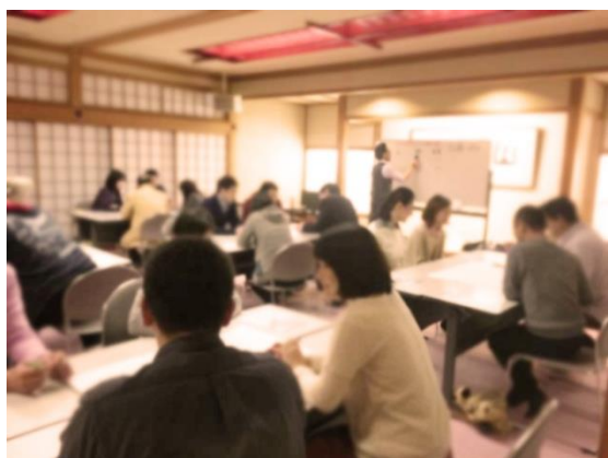
▲ワークショップ開催風景