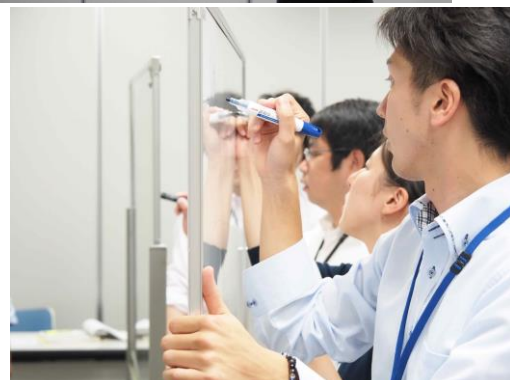
地元男性がワークショップで奥能登の“ヒト、マチ、ミライ”を自ら考え、女性向けのPRコンテンツを制作済。(6月)