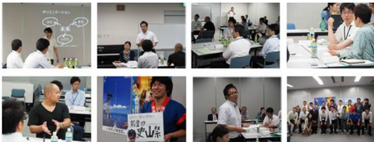
石川県・奥能登でのワークショップ風景

地方の少子化対策を「ライフデザイン」により効果を高めるプロジェクト 自分たちの町の未来、自分の人生、そして自分たちの仕事の未来に目を向けて 都市から地方への流れをつくる好事例化をめざします。