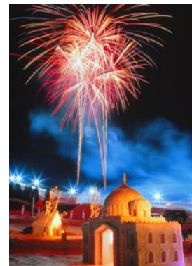
田沢湖高原雪まつり風景

当事業では、2月に開催される「田沢湖高原雪まつり」への婚活ツアーで最大の成果を目指すべく、事前の地元および首都圏での一連のプログラムで、地元への理解を深めてもらうと共に、興味を喚起してまいります。まずは、先行チームとして、仙北市の自治体職員、商工会議所青年部、農協、観光協会などから、町おこしに興味のある有志男性が集まり、仙北市の未来、さらには自分たちのことや仕事の未来について考え、女性へのPRコンテンツを制作します。その他、地元でのライフデザイン講座や独身女性を対象にした首都圏でのPRイベントなどの交流の場を提供してまいります。