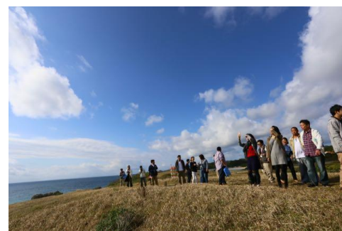
▲過去のツアーイメージ

高野山の魅力を体感できるツアーで、男女の自然な交流を促進。「高野山観光」を始め、「はたごんぼ堀体験」や「普賢院での阿字観体験」などを通じて、単なる観光ツアーにとどまらない、地方暮らしのイメージを具体化できるツアー内容となっています。さらに、婚活のプロが同行し交流のサポートを行います。