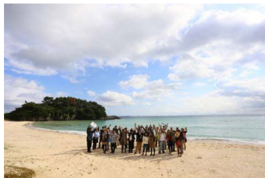
「ミライカレッジ壱岐」(長崎県壱岐市・2015年、2016年)写真は2016年のツアー。2015年のツアーで出会ったカップルが成婚された。