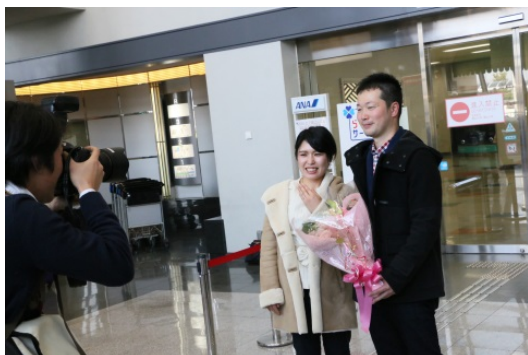
「ミライカレッジ佐賀」(佐賀県全域・2015年、2016年)写真は2015年のツアーで出会い成婚されたカップルのサプライズプロポーズの様子。

地方創生が話題になる中、地方暮らしに興味を持つ女性も増えています。ツヴァイでは、地方創生を「地域活性化」と「結婚支援」の両面から取り組む、「ミライカレッジ」プロジェクトを2015年度より展開しています。既に20を超える都道府県において自治体より受託しており、首都圏の女性を地方に招く婚活ツアーなどのイベントでは、約300組みのカップルが成立、ご成婚カップルも誕生しています。単なるお相手探しの場ではなく、ライフデザインの視点から仕事、家族、人生について考える機会を若者に提供しています。「ミライカレッジくまもと」においても、若い女性の地方への興味を促進し、移住・定住に繋げていくことを期待しています。