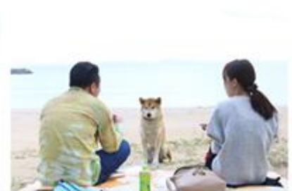
※昨年度「ミライレッヅ吉岐」ツアーの様子