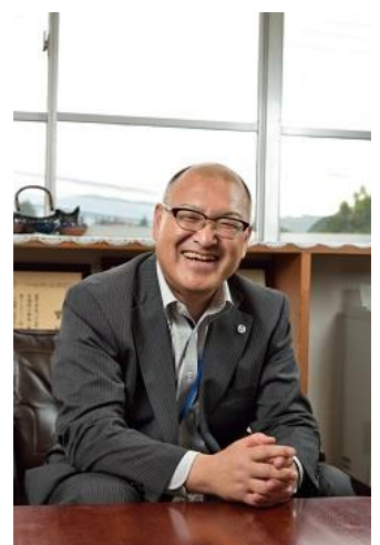
笑顔が素敵な仙北市の門脇市長