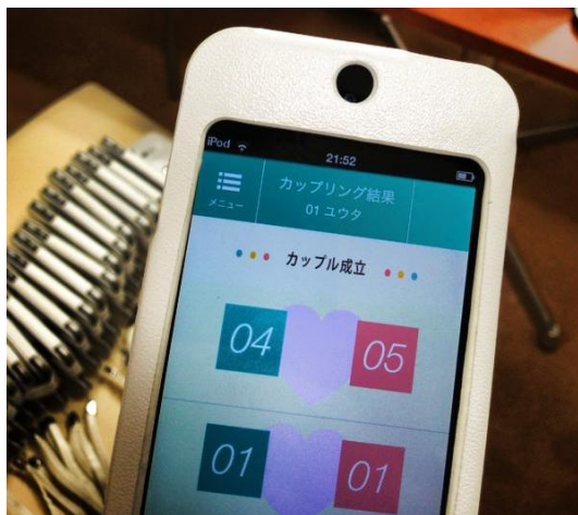
カップリングの結果