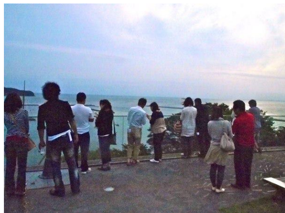
カップルになった漁師さんたち。カップル率は80%