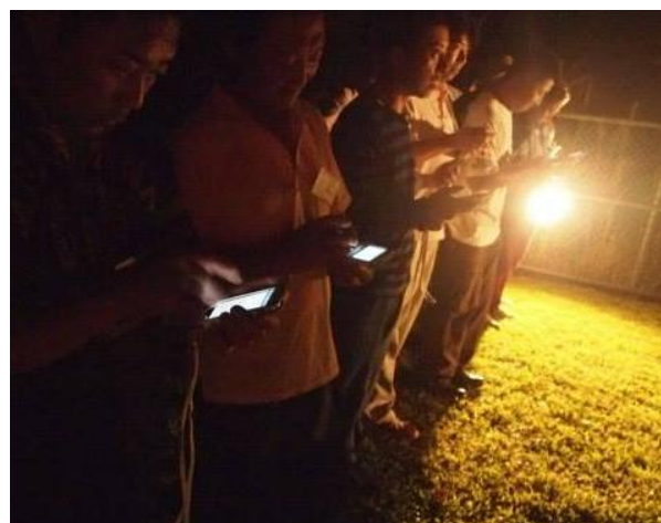
スマートフォンを初めて触る浜の漁師さんたち

「クラブチャティオ」では、月間200回以上の様々なスタイルの婚活イベントを開催してまいりました。今後も、単なる男女の出会いの機会を提供するだけの「婚活」を変えるべく、新しいサービスを順次導入し、より成功につながる魅力ある婚活イベントへと進化してまいります。