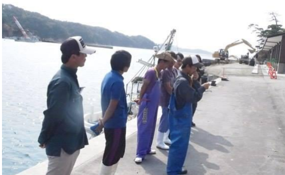
実証実験の舞台となった石巻・浜こん2013