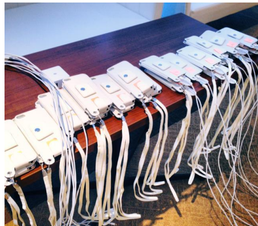
検証に利用した40台の携帯デバイス