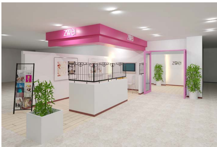
< 「ツヴァイ松本」 エントランス (イメージ図) >