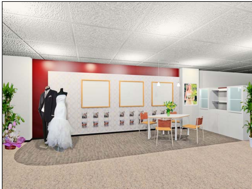
＜ブライダルサロン(イメージ図)＞